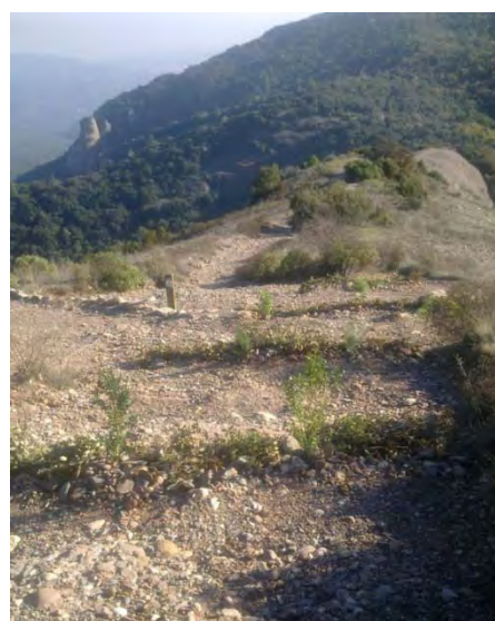
Feixines i plantació de boixos, per tal d'adreçar el pas pel camí principal