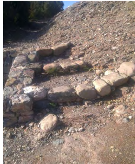
Imatge de les escales ja consolidades

Cal remarcar que s'està duent a terme un seguiment del resultat de les intervencions realitzades, i que en tres seguiments realitzats l'any 2011 s'ha constatat una clara concentració dels vianants dins el traçat i per tant preveiem una recuperació de la cobertura vegetal amb resultats a curt i llarg termini (per exemple, les codines triguen anys a recuperar-se).