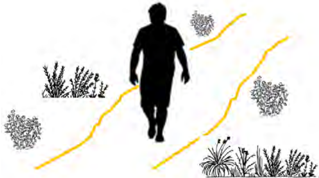
Imatge esquemàtica del marcatge del camí principal

El marcatge del camí principal s'ha realitzat mitjançant la instal·lació d'una corda arran de terra marcant i definint l'amplada del camí. S'ha realitzat una fixació cada 3 metres en els trams on està prevista la corda, amb un total de 267 fixacions i una longitud de 800 m.l. de corda. La corda convida als usuaris a circular pel camí de entre cordes i possibilitar així la recuperació de la fràgil vegetació dels codolars.