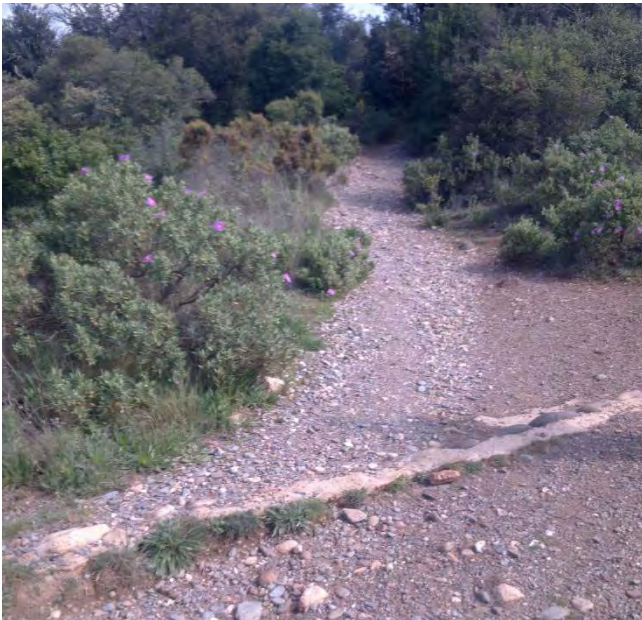
Imatge inicial d'una trenca al camí de Coll d'Estenalles

I finalment, s'ha augmentat la longitud de les trenques que tenen dificultat en la realització del desguàs.