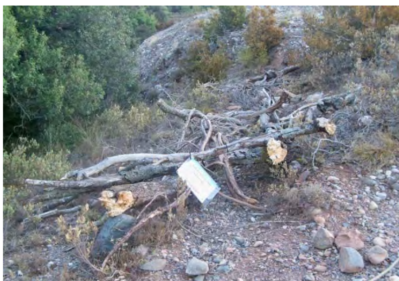
Imatge de l'aportació de branca de fusta lligada al sòl

Per tal d'adreçar el pas pel camí principal, s'han portat a terme actuacions de tancament de les drecceres existents mitjançant l'aportació de branca de fusta lligada al sòl, aportació de terra vegetal i/o plantació d'arbusts on es forma la dreccera, i així fer-la inaccessible. Les plantacions són poques i experimentals doncs s'està realitzant un seguiment per valorar la seva vitalitat.