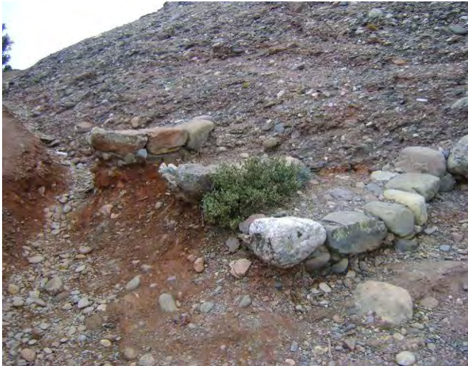
Imatge inicial abans de la consolidació d'unes escales al camí del Coll d'Eres