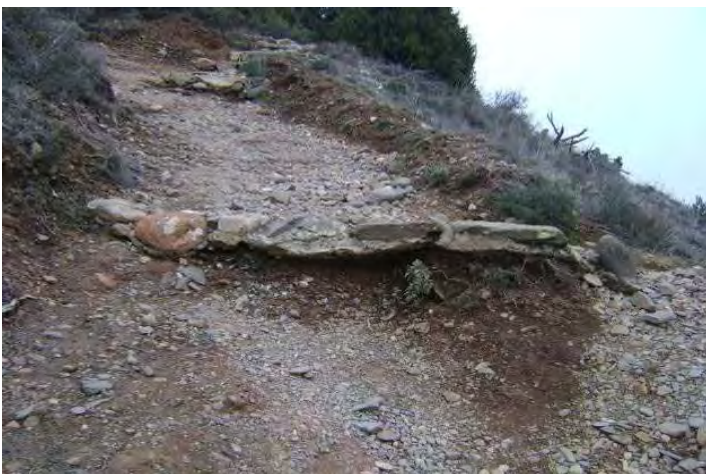
Imatge inicial d'una trenca amb la part frontal desestructurada al camí de Coll d'Estenalles