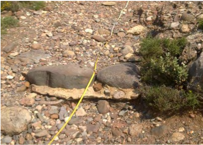
Imatge inicial d'un esglaó al camí de Coll d'Estenalles

I s'han consolidat les escales presents amb un mur de pedra amb fonament al roqueter del camí de Coll d'Eres al Montcau.