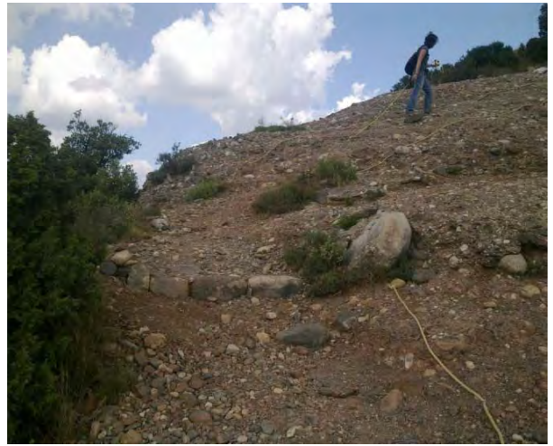
Imatge posterior de l'esglaó, on s'han afegit d'altres