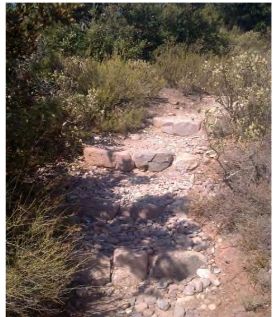
Imatge posterior dels esglaons, on s'han instal·lat dos esglaons més abans per tal de consolidar l'estructura i facilitar el pas