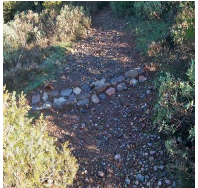
Imatge de la trenca un cop realitzades les actuacions de manteniment