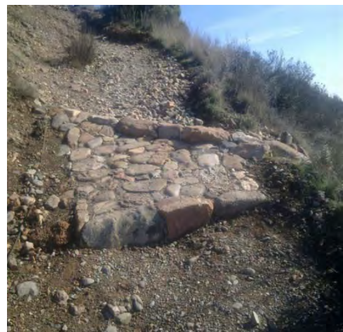
Imatge de la trenca un cop realitzades les actuacions de manteniment