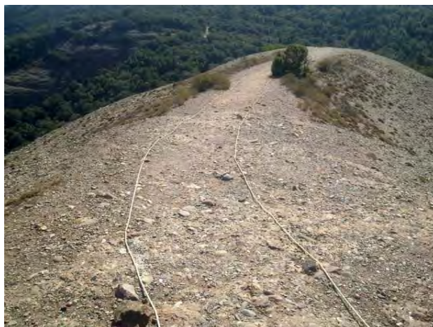
Vista del marcatge del camí principal

El marcatge del camí principal s'ha realitzat també mitjançant la instal·lació d'una corda arran de terra marcant i definint l'amplada del camí. S'ha realitzat una fixació cada 3m en els trams on està prevista la corda, amb un total de 82 fixacions i una longitud de 500 m.l. de corda.