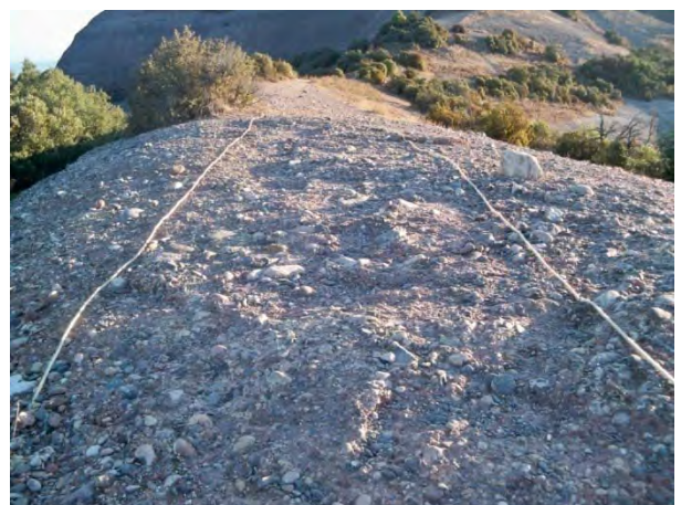
Vista del marcatge del camí principal