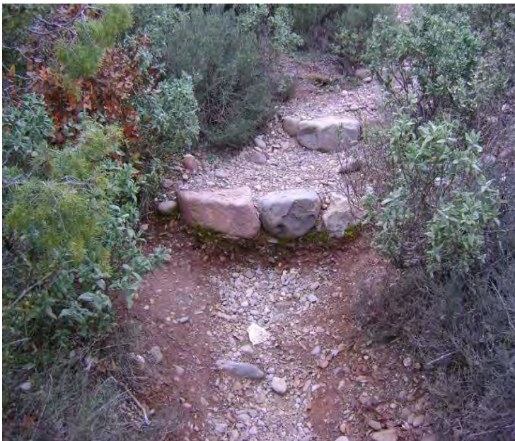
Imatge inicial d'esglaons en un tram del camí del Coll d'Eres