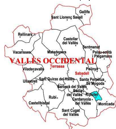
Mapes de localització