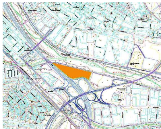
Zona d'ubicació del projecte

L'objectiu principal del projecte ha estat la planificació de diverses tipologies d'actuacions necessàries per a la creació d'una zona d'horts municipals en un terreny de 3,7ha que s'estén sobre els marges drets dels rius Ripoll i Sec, i sota l'autopista C-58 a l'alçada de connexió amb la BV-1411, entre Ripollet i Montcada i Reixac. La realització de les actuacions permetrà la reubicació de tota l'horta marginal que actualment està situada dins la llera. Aquest projecte és, per tant, una eina per a la l'Ajuntament que conté les mesures necessàries per gestionar una zona d'horta amb sistemes àgils i de baix cost.