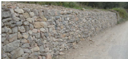
Exemple de mur de pedra seca restaurat